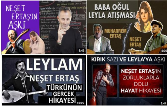
Fotoğraf 1: Neşet Ertaş'ın hayat hikayesinden bazı detayları internette içerik olarak sunan videolar. Bkz. Karaman (2019), Argonomi (2021), Sesli Şiirler (2019), Yeni Nesil Tv (2021).

Kıscacası, internet, halk müziği için önceki medya araçlarında görülebilir olmayan unsurların da sanatın anlam çerçevesine eklenebilmesi konusunda bu genişlikte hiçbir ortamla karşılaştırılmayacak derece geniş bir etkileşim ortamı sağlamıştır denilebilir. İnternet çağında sanatın tanımı yine toplumsal iletişime bağlıdır ancak toplumsal farklılıkların bu denli “görünür” olduğu bir iletişim ortamı daha önce mevcut değildir. Artık toplumsal farklılıklara dayalı olarak yeniden yorumlanan sanat ve sanatçı imgesi de dolayımdadır.