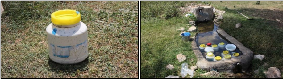
Fotoğraf 4. Yaylada peynir üretimi ve üretilen peynirlerin muhafazası

Yayla ekonomik olarak da büyük bir önem arz etmektedir. Bu dönemde süt sağımı yapılmaktadır. Sağılan süt, miktarına göre aynı gün veya birkaç gün biriktirilerek işlenmektedir. Bu kapsamda tereyağı, yoğurt ve peynir üretilmektedir. Tereyağı ve yoğurt ailenin ihtiyacı kadar üretilirken, peynir daha fazla üretilmektedir. Üretilen peynirler suyundan arındırılarak tuzlanmakta ve içine maya kekiği/kaya kekiği ( Saturejacuneifolia ) serpiştirilerek plastik bidonlara basılmaktadır (F:4). Bu bidonlar yaylada konaklanan süre boyunca sütlükler ile çeşmelerin hatıllarında muhafaza edilmekte olup, yayladan köye dönüşte satılmaktadır. Yine son yıllarda Kurban Bayramlarının yaz aylarına denk gelmesi ile birlikte yaylada kurbanlık koyun ve kuzu satışları da gerçekleştirilmektedir.