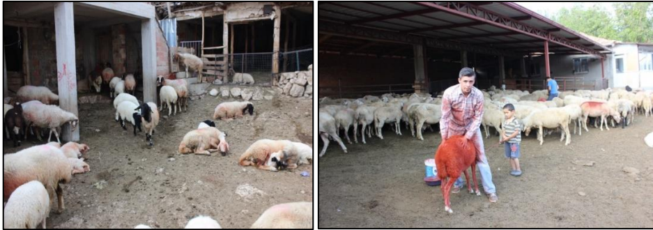
Fotoğraf 1. Hasanpaşa köyündeki farklı hayvan barınaklarından görünüm

K.K.1 ve ailesi köyde yaşayan birçok aile gibi kış aylarını kendi evlerinde geçirmektedir. Yarım asrı aşkın bir süredir koyun yetiştiriciliği yapan K.K.1 Hasanpaşa köyü haricinde herhangi bir kışlak kullanmamış ve göç etmemiştir. Kışlak olarak kullanılan mesken tipi ise köy evi ve eklentilerinden oluşmaktadır. Burada aynı avlu içerisinde ev, ahır samanlık ve depo gibi eklentiler bulunmaktadır (F:1).