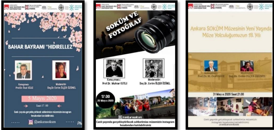
Görsel 2. Ankara Somut Olmayan Kültürel Miras Müzesi Instagram Konferans Afiş örnekleri