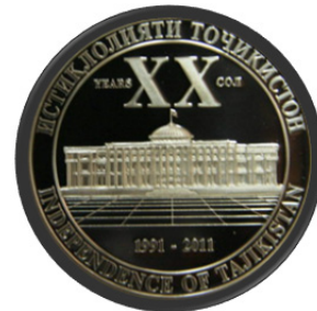
Şekil 1: XX Years/Sol, 1991-2011 İstikloliyati Tocikistan Independence of Tajikistan

Yeryüzündeki karaların altında birini kaplayan, coğrafi sınırları itibarıyla tarihin kaydettiği en büyük