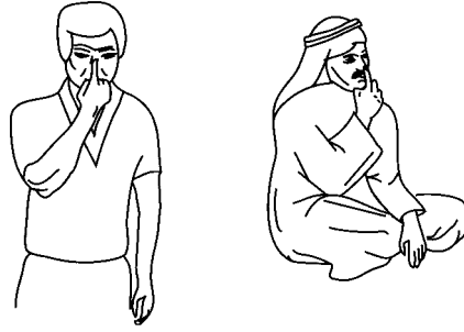
Japonca “ben”, Arapça’da “benden istediğini yapacağım” demektir.

Aşağıdaki örneklerden de görüldüğü gibi, aynı jestler çeşitli kültür çevrelerinde farklı anlamlara gelebileceği gibi, farklı jestler de aynı anlama gelebilir.