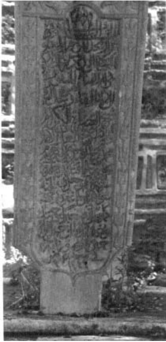
Resim 2: Lahit şeklinde mezar 1