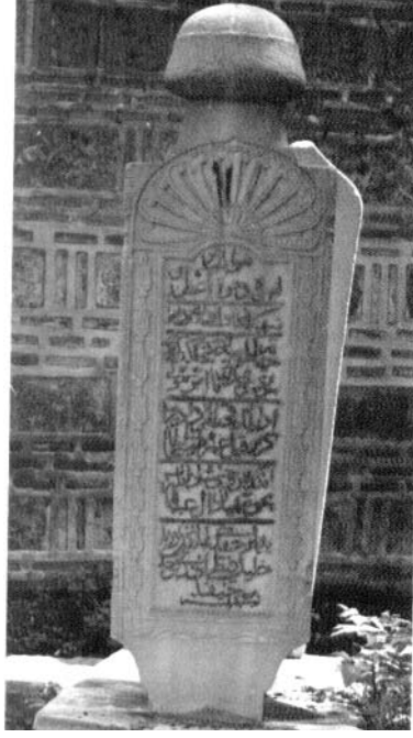
Resim 3: Lahit şeklinde mezar 2