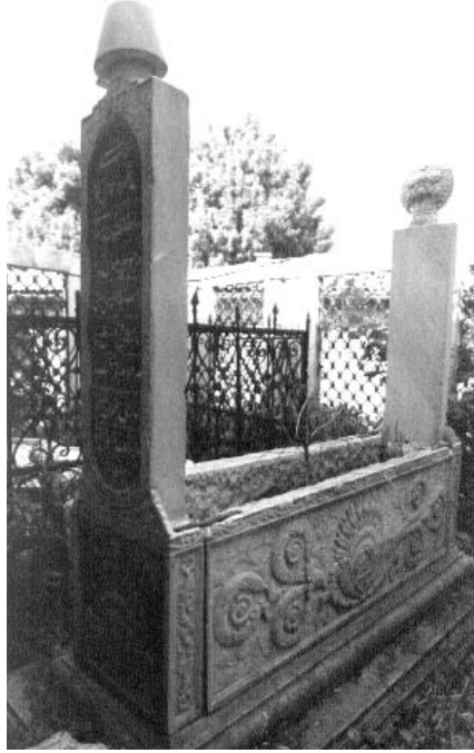
Resim 8: Lahit şeklinde mezar 4