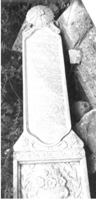
Resim 5: Lahit şeklinde mezar 3