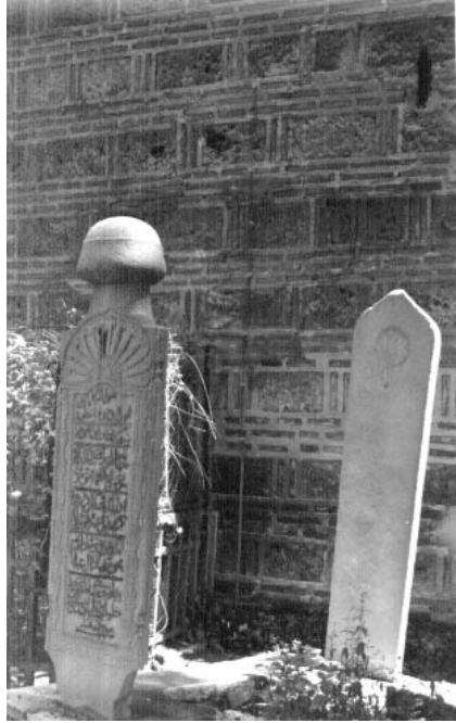
Resim 4: Lahit şeklinde mezar 2