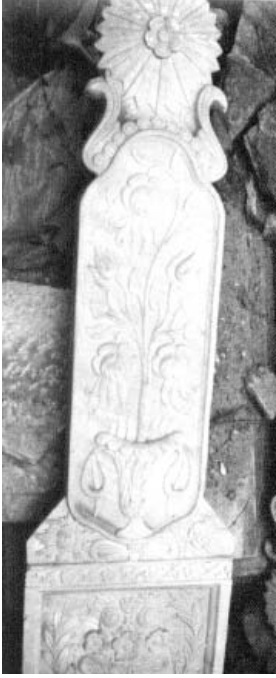
Resim 6: Lahit şeklinde mezar 3