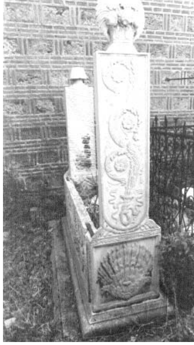
Resim 7: Lahit şeklinde mezar 4