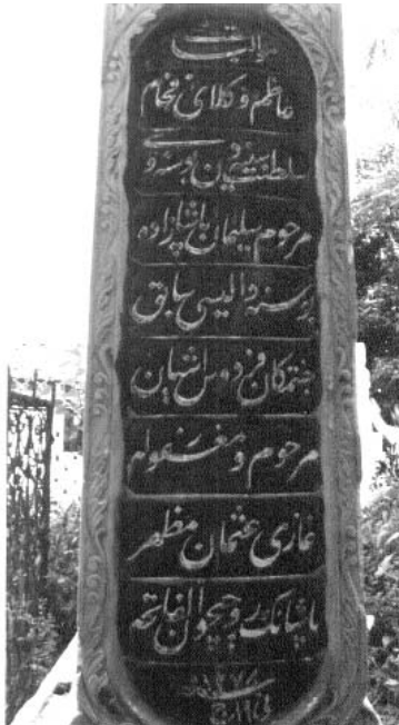
Resim 10: Lahit şeklinde mezar 4