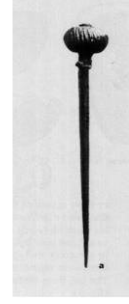
Levha 2: Kültepe'den bronz iğne Özgüç 1986: pl. 11 a-b.

Geç Hitit Dönemi tanrıçası Kubaba'nın sembolleri de, Anadolu'da bitkinin tanındığını kanıtlar niteliktedir. Tanrıça Karkamış'ta bulunan tasvirlerinde, elinde ayna ve nar/haşhaş tutarken betimlenmiştir. Hnila (2002:315-323), Kargamış'tan gelen bir Kubaba tasvirini, Birecik ve Ancuzköy'de bulunan birkaç örnekten yeni-