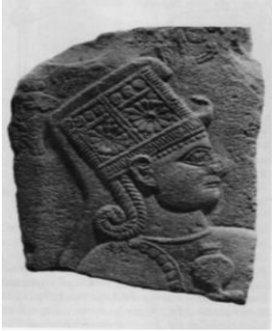
Levha 3: Karkamış Kubaba Tasviri Bossert 1942: no. 866

yola çıkarak, bu betimlerde yer alan meyvenin uzun saplı olması, elde tutulma şekli ve taç yapısına dikkat çekilerek, bunların nar olmayıp, haşhaş olabileceği ihtimali üzerinde durmuştur (Levha 3-4). Hnila, haşhaş ve nar tasvirlerinin sıklıkla birbirine karıştırıldığını, daha önce nar olarak kabul edilen birkaç tasvirin, haşhaş olarak