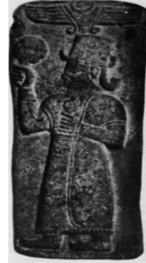
Levha 4: Birecik Kubaba Kabartması Akurgal 1961: Abb.115

den değerlendirildiğini ifade etmiştir. Haşhaş bitkisi ve bolluk/bereket sembolü olarak kabul edilen haşhaş kapsülü başlı metal süs iğnelerinin, Urartu sanatında da büyük önem taşıdığı ifade edilmektedir. Söz konusu iğneler günümüzde Ahlat Müzesi'nde yer almakta ve M.Ö. 8. ve 7. yüzyıla tarihlendirilmektedir (Göğtaş vd. 2019: 535vd.).