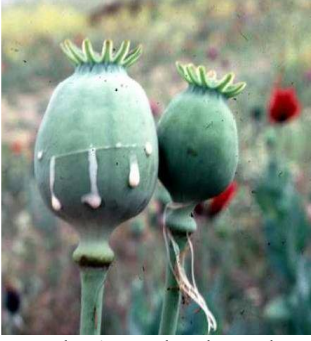
Levha 1: Haşhaş kapsülü Mat 2009: 287.