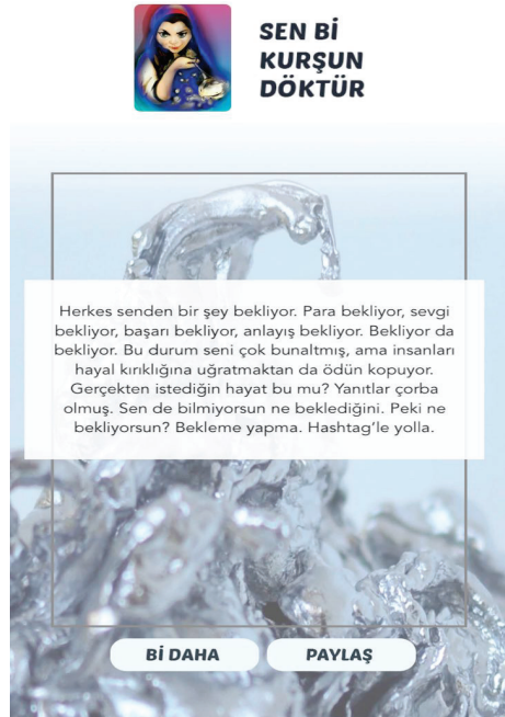
Resim 3.