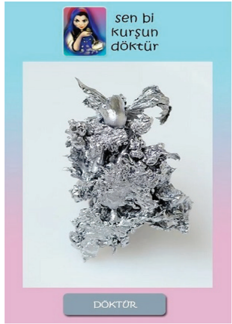
Resim 2.