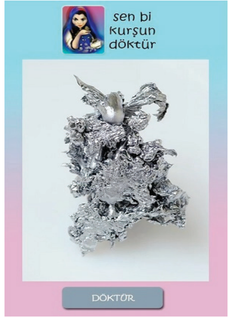
Resim 2.