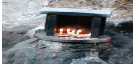
Foto 5: Kurban tığlanırken yakılan mum. Eski Türklerde kurban kesilirken ya da kötü ruhlardan korunmak için mum yakılmıştır. Tunceli/ Gole Çetu ziyareti.