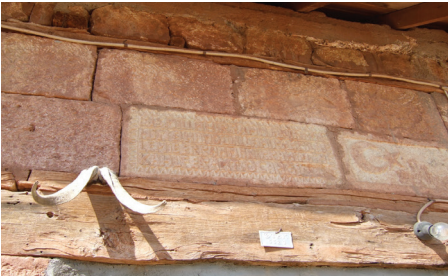
Foto2: Köy evlerine asılan kurban boynuzları, Tunceli.