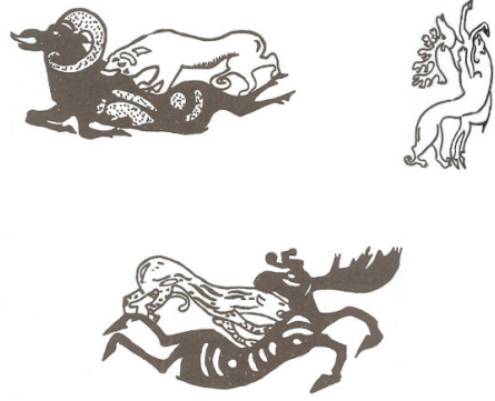
Şekil 3: Altay Hun Çağına ait Pazırık Kurganlarında bulunan resimler

Aynı zamanda geyik görsel ve mitolojik enerjisini yitirdi (Jacobson 1993: 47). Hatta zamanla at geyiğin yerini aldı (Jacobson 1993: 32). Bu dönüşümde geyiğin boynuzları, boynuzunun çatalları ve kuşlar birbirine karıştı. Örneğin geyiğin kafası kuşa benzer şekilde resmedildi (Jacobson 1993: 55). Daha sonra da geyiğin resimleri anlamsız kalıplaşmış resim formunda karmaşık ve anlamsız bir hal aldı (Ögel 2003:578).