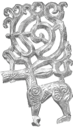
Şekil 2: M.Ö. 4. yy.a ait altın işlemeli geyik tasviri

Yine Jacobson yaratıcı, hayatın kaynağı ve soyun atası olarak kabul edilen geyiğin “Erken Göçebe” ve “İs-Kit-Sibirya” kültürünü anlamak için yegâne anahtar olduğunu ileri sürmektedir (Jacobson 1993: 46, 1-4) Sibirya kültüründe güneş, altın ve geyik birbirleri ile özdeşleştirilmiş ve kabile-nin kökeni olarak kabul edilmişti (Jacobson 1993: 33).